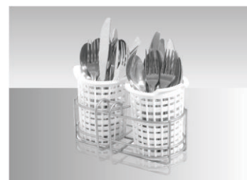
01 Suporte inoxidável para até 30 talheres em pé.