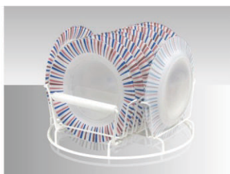
01 Suporte inoxidável para 10 pratos até Ø 280 mm.