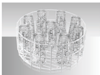
01 Cesto universal inoxidável para até 24 copos.